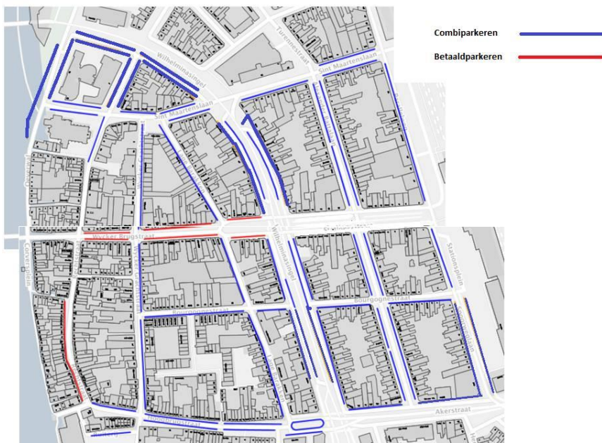
Figuur 2: Nieuwe parkeerregulering voor Wyck voor bewoners en bezoekers

In onderstaande figuren is deze regulering ruimtelijk weergegeven.